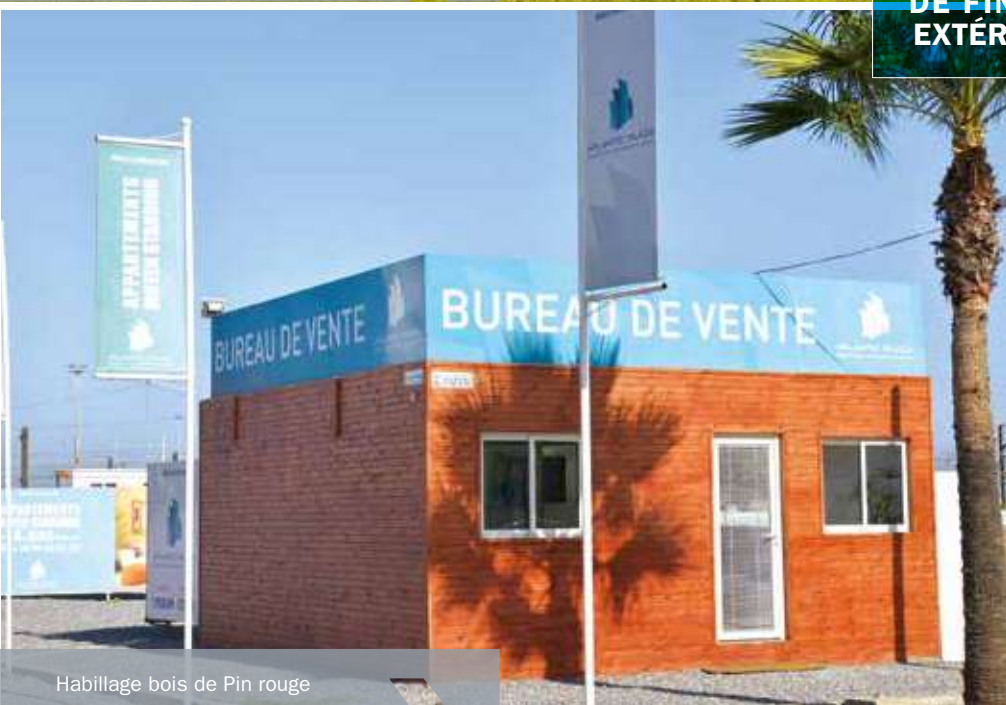
Habillage bois de Pin rouge