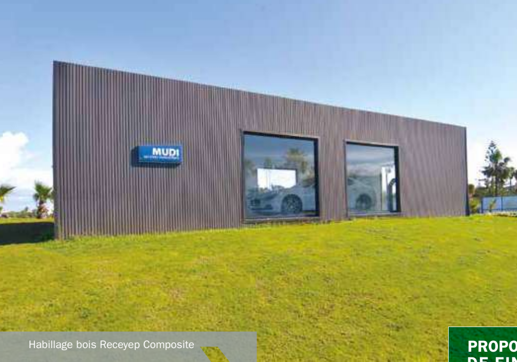
Habillage bois Receyep Composite