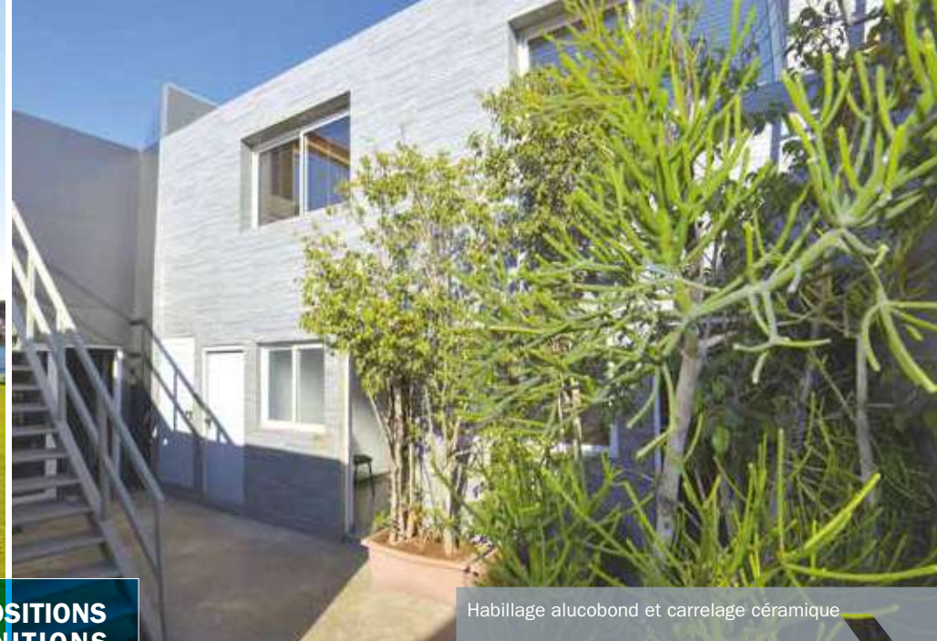
Habillage alucobond et carrelage céramique